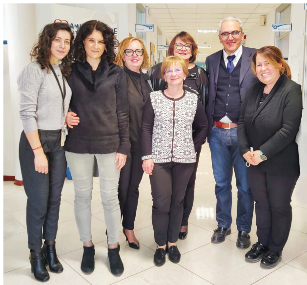
Il Team di CardioAction