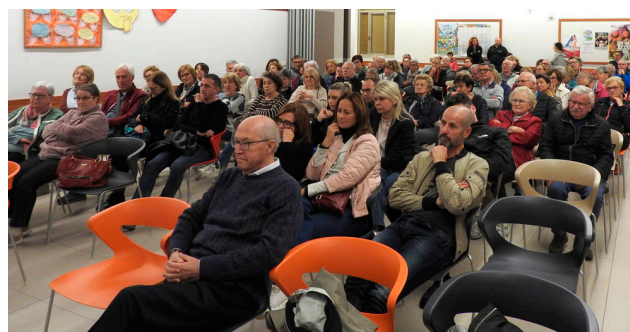
Panoramica della sala