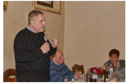
il Sindaco di Piovene Rocchette Sig. Erminio Masero