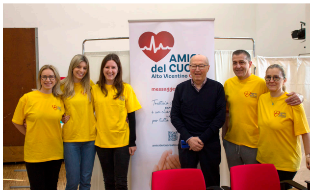
Team volontari dell'UCIC Santorso con il Presidente AdC