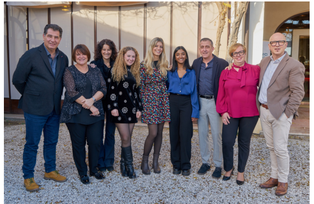
Personale della Cardiologia