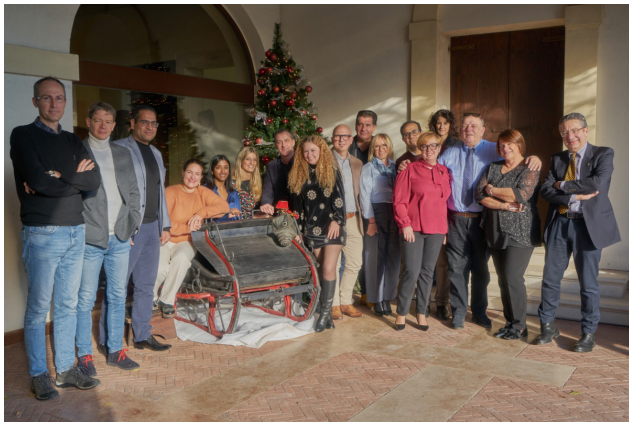
Medici e Infermieri