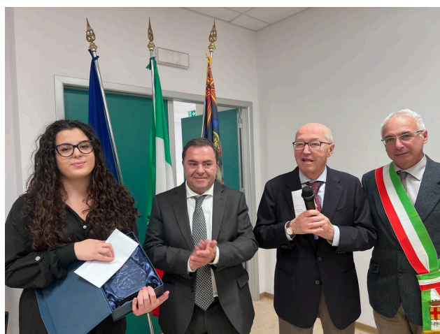
D.G., Presidente e Sindaco