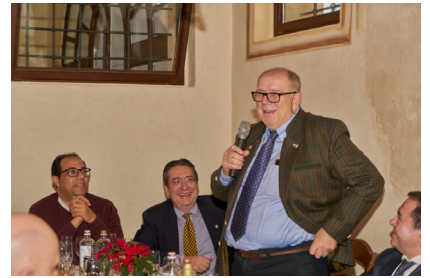
Past Primario di Cardiologia