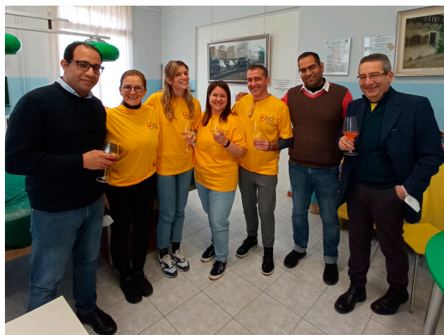
Prevenzione Cardiovascolare a Lugo di Vicenza (21/01/2023): i Volontari che hanno fatto oltre 130 ECG.