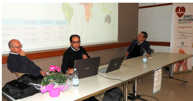
Evento "La malattia coronarica nelle donne" a Cogollo del Cengio