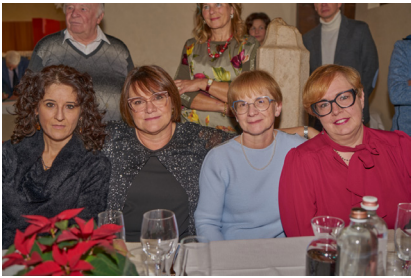
il Team di CardioAction