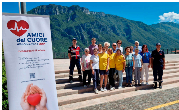
Volontari dell'UCIC e Volontari dell'Associazione