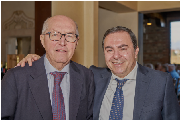
Presidente AdC e Direttore Generale ULSS 7