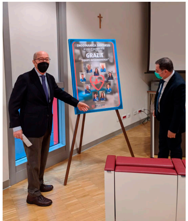
Presidente Associazione e Direttore Generale ULSS7 al momento celebrativo presentazione del Pannello Emodinamica Santorso