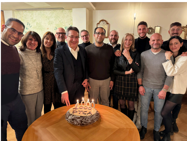
Festeggiamenti per le 4000 PTCA eseguite a Santorso