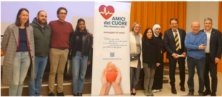
Gruppo Volontari di Carrè all'evento del 22 marzo 2024