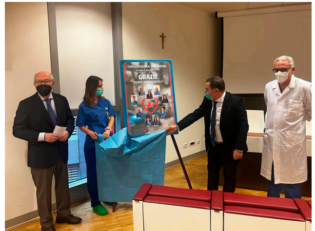
Presidente, Infermiera, Direttore Generale, Primario