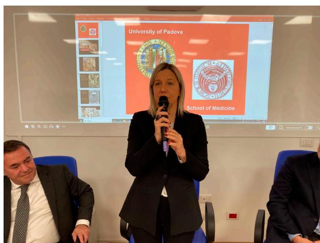
D.G. e Assessore Regionale

Schio - Sede staccata dell'Università di Padova