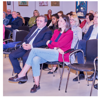
Direttore Generale e Sindaco