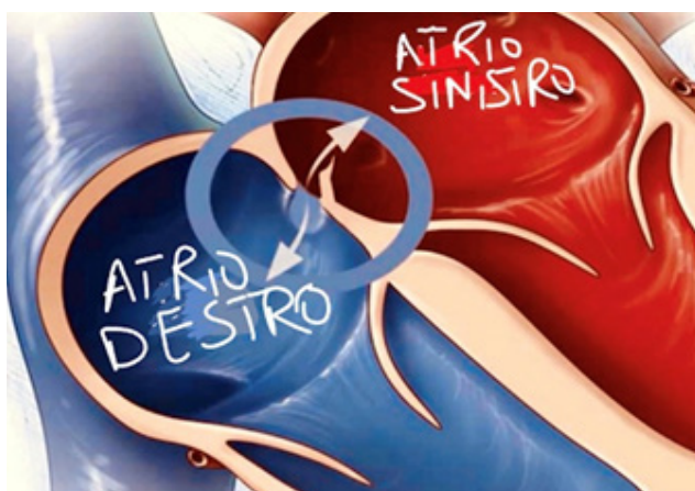
Immagine 1: il difetto interatriale (Forame Ovale Pervio)

Questo foro dopo la nascita viene chiuso per aderenze, ma rimane aperto nel 25-30% della popolazione (Immagine 1).