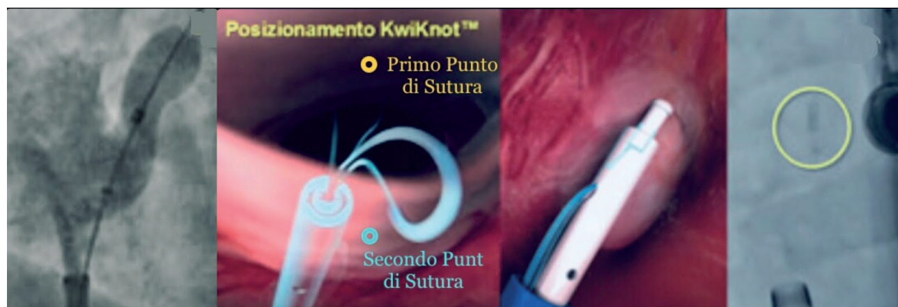
Immagine 3: la chiusura con punti di sutura del forame ovale pervio con la tecnica innovativa senza protesi.