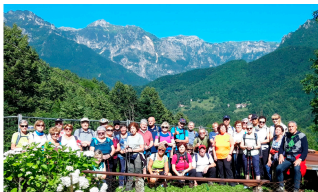
Posina (sabato 22 giugno 2024)