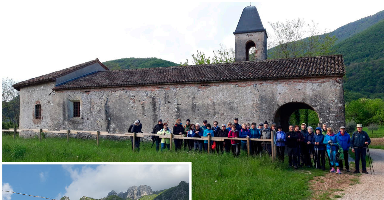
Sant'Agata (sabato 20 aprile 2024)

La partecipazione è aperta ad Associati, familiari e amici