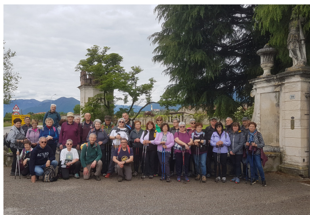
Sarcedo (sabato 4 maggio 2024)