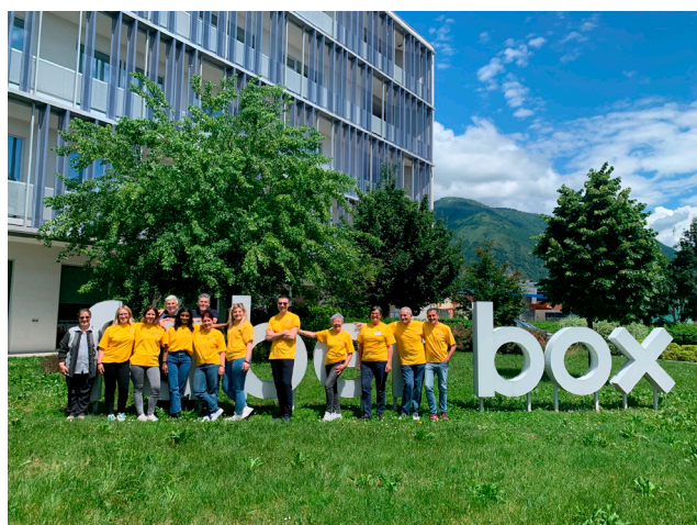
Prevenzione a Schio presso il Faber Box