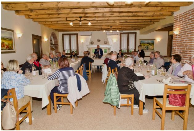
Incontro di Primavera dei Referenti (Agriturismo "La Meridiana" di Marano Vic.no - 30 maggio 2024) panoramica della sala