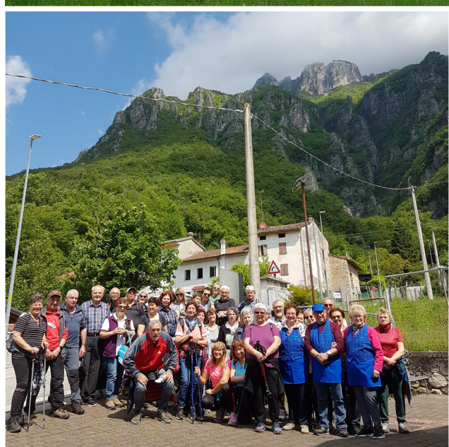
Cogollo del Cengio (sabato 18 maggio 2024)