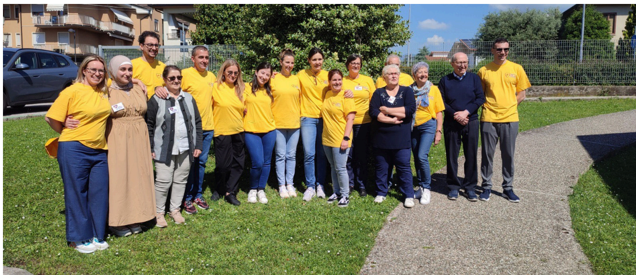
Prevenzione a Thiene Ca' Pajella