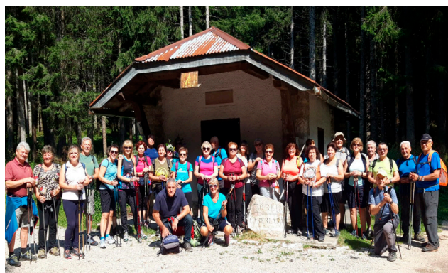
Kaberlaba (sabato 27 luglio 2024)