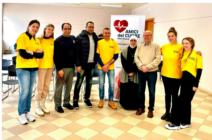
Prevenzione a Piovene Rocchette