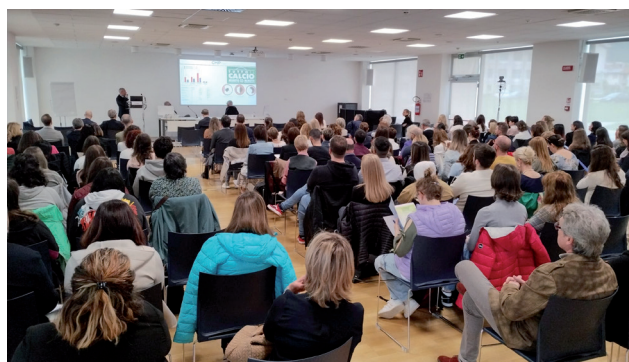
panoramica della Sala Meeting Box

Un altro contributo molto importante ed apprezzato offerto dagli Amici del Cuore Alto Vicentino è stata la registrazione del Convegno, con la possibilità, per tutti i sanitari e gli eventuali interessati che, per varie motivazioni, non hanno potuto essere presenti al convegno, di rivedere tutte le relazioni sul sito web degli Amici del Cuore ( https://www.amicidelcuorealtovicentino.org/cardiologia-san-torso/ ).