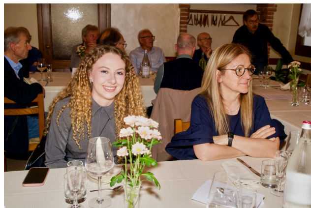
Incontro di Primavera dei Referenti (Agriturismo "La Meridiana" di Marano Vic.no - 30 maggio 2024) Volontari dell'UCIC