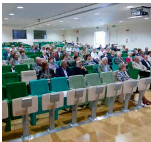
Assemblea Ordinaria 21 aprile 2018 - tenutasi presso la Sala Convegni dell'Ospedale Alto Vicentino di Santorso