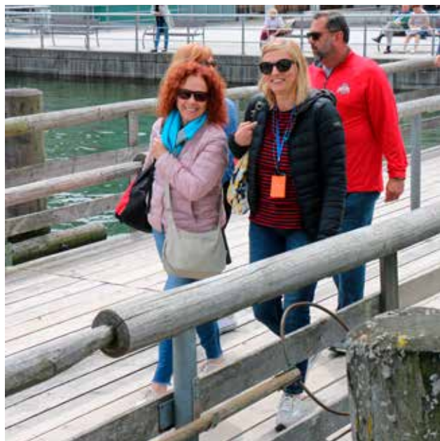
Prien imbarcadere sul Chiemsee

un gioiello nascosto da vegetazione florida in un'isola del lago Chiemsee. Modello ridotto della reggia di Versailles, con un particolare che, non solo la eguaglia ma addirittura la supera. La galleria degli specchi è ben 25 metri più lunga dell'originale francese. Potrei parlare del suggestivo castello di Neuschwanstein, delle sue infinite decorazioni dorate e rare, delle sale lussuose, della cucina ottocentesca ma dalla funzionalità moderna, oppure portarvi a Linderhof, nella solitudine dei boschi bavaresi, fra le fontane del parco, le scalinate, i fiori. Oppure insieme andare a Monaco, splendida città che offre meraviglie senza infondere l'ansia delle grandi metropoli. Potrei anche parlare di alcune sensazioni negative, ad esempio l'eccesso di sfarzo,