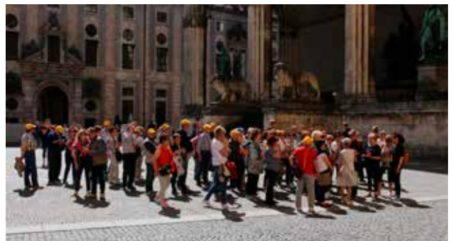
Monaco di Baviera

dere passioni. Ho avuto modo di dialogare piacevolmente con due sorelle, appassionate di giochi con le carte, una passione che mi appartiene fin dall'infanzia e che raramente viene valutata interessante tanto quanto appare a me. In loro ho captato lo stesso interesse e, devo dire, mi è piaciuto molto. La possibilità di spezzare il quotidiano vivere, tuffandosi in "avventure" diverse che stimolano spirito e corpo ad essere migliori, a dimenticare acciacchi e dispiaceri, a ritrovare il desiderio di sorridere ed amare.