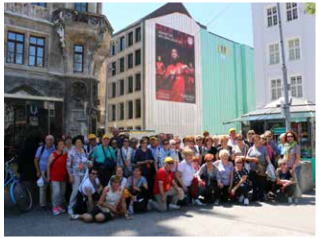
Monaco di Baviera