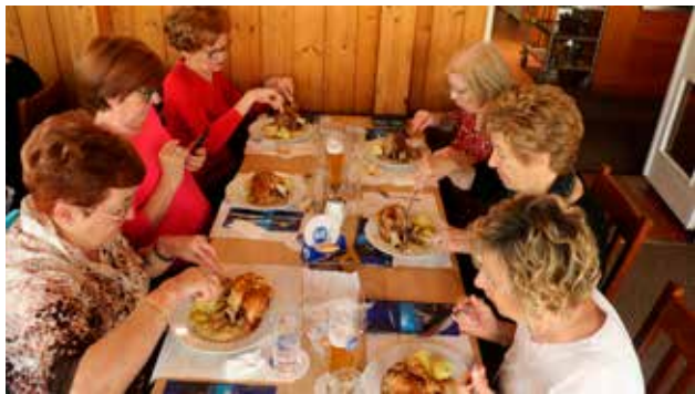
Castello di Neuschwanstein

amicizie, l'amore, la socializzazione, il pensiero, i desideri, la voglia... Non si toccano con mano, ma si concretizzano nel cuore. Il cuore è il nostro muscolo principale, affinché funzioni adeguatamente va costantemente stimolato, allenato, tenuto vivo e pulsante. Tutta questa premessa pseudo filosofica, ha in realtà un senso pratico. Se si sarà in grado di mantenere attivo il cuore, ogni giorno sarà un giorno nuovo, tanti attimi da assaporare, da godere, da apprezzare, da amare.