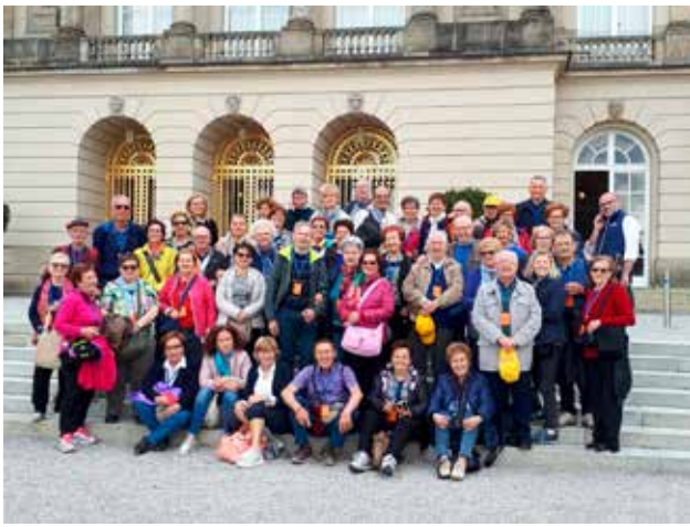
Castello di Chiemsee