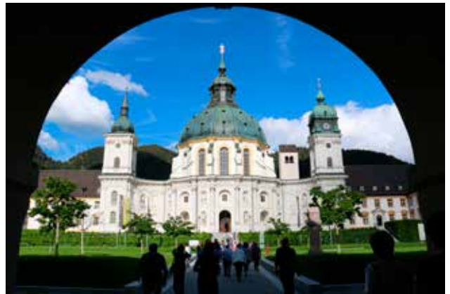
Abbazia di Ettal

Cosa mi è rimasto in cuore di questa "passeggiata" in Baviera? L'elenco è lungo, ma provo a sintetizzare, proprio per non rovinare l'incanto magico di un sogno. Sessanta persone adulte, molto adulte, la maggioranza con problemi di cardiopatia e forse altri acciacchi che non posso conoscere, ma tutti con addosso lo stesso entusiasmo di guardare, di vivere, di imparare, di divertirsi, di raccontarsi. Quel profumo di amicizia che aleggiava nell'aria calda di una primavera finalmente esplosa, un aroma che si univa in modo del tutto naturale alla fragranza dei fiori di maggio. Tanta voglia di sorridere, di scherzare, di ironizzare, lo stupore di assaporare cibi diversi, di osservare abitudini a noi sconosciute, di odorare profumi inusuali. La possibilità di gustare nuove amicizie, di scambiare opinioni, di condivi-