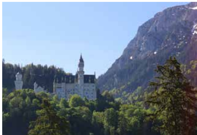
Castello di Neuschwanstein

Potrei decantare la meraviglia del castello di Herrenchiem,