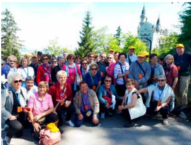
Castello di Neuschwanstein

dere passioni. Ho avuto modo di dialogare piacevolmente con due sorelle, appassionate di giochi con le carte, una passione che mi appartiene fin dall'infanzia e che raramente viene valutata interessante tanto quanto appare a me. In loro ho captato lo stesso interesse e, devo dire, mi è piaciuto molto. La possibilità di spezzare il quotidiano vivere, tuffandosi in "avventure" diverse che stimolano spirito e corpo ad essere migliori, a dimenticare acciacchi e dispiaceri, a ritrovare il desiderio di sorridere ed amare.