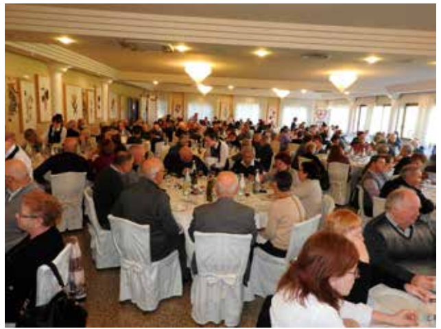
Panoramiche salone durante il Pranzo degli Auguri