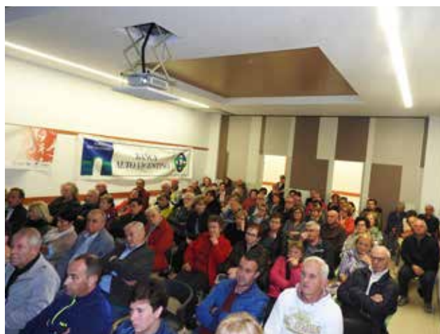
25 ottobre 2019: Convegno a Cogollo del Cengio (Panoramica della sala)