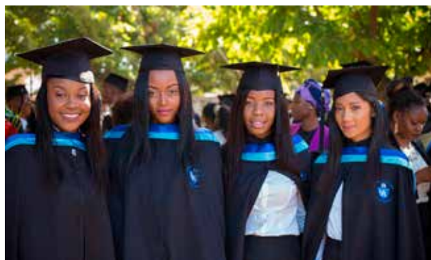
Neolaureati dell’Università di Beira Mozambico

Le strutture dell’Università cattolica del Mozambico sono state gravemente danneggiate. Distrutto il tetto, danneggiate le aule, la biblioteca, i laboratori, con tutto il materiale didattico e l’attrezzatura. Gli studenti per primi si sono dati da fare per rimuovere le macerie e rendere gli spazi agibili. Nell’ultimo periodo hanno fatto lezione e studiato all’aperto.