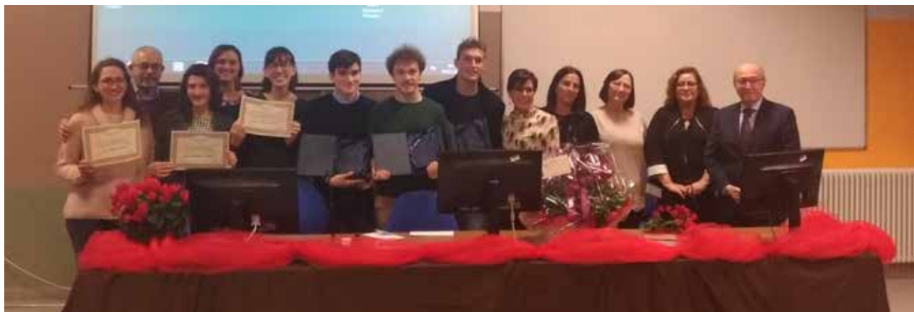
Tutor del Corso Universitario e Presidente