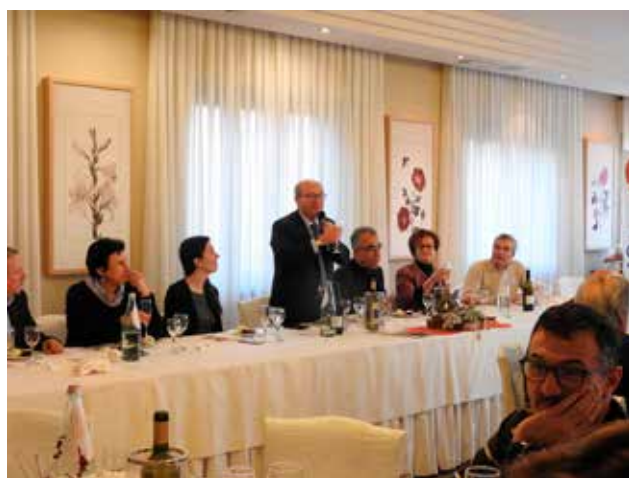
Brindisi di Buon Natale e Felice Anno Nuovo