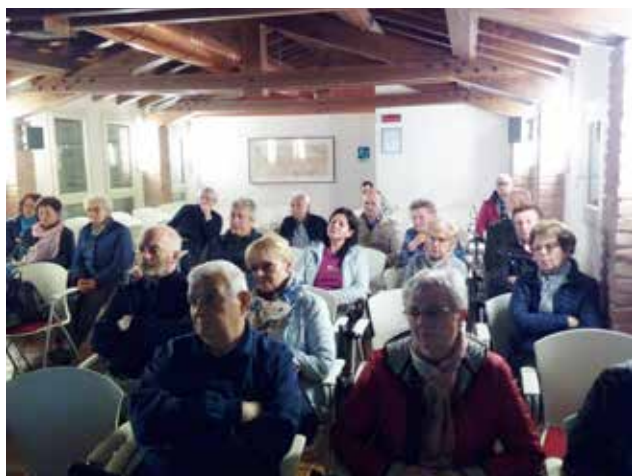
17 maggio 2019: Panoramica della sala